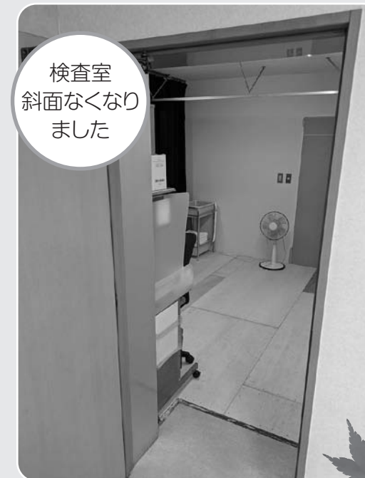
検査室 斜面なくなりました