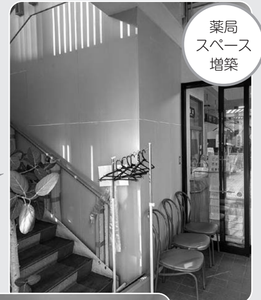
薬局スペース増築