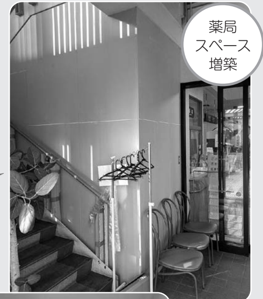
薬局スペース増築