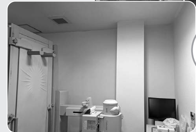
放射線室 壁紙変わりました