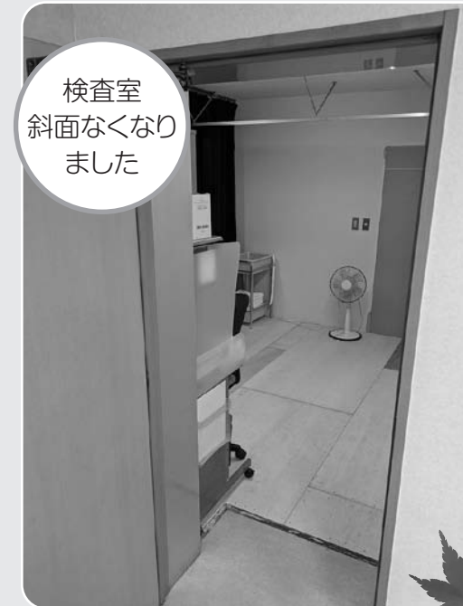
検査室 斜面なくなり ました